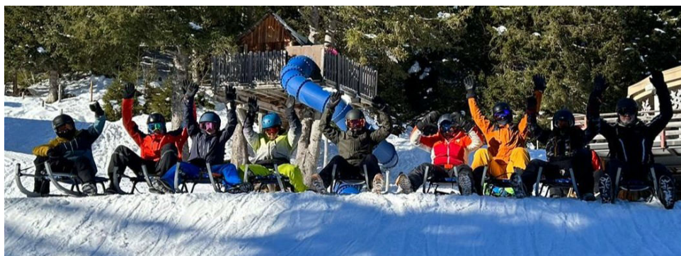
Massenstart am Jungschwinger-Schlitteltag